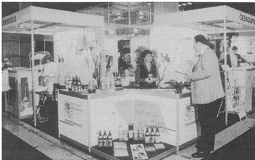
... Expozice byla koncipována ke třicátému výročí Jizerské padesátky v duchu principů zdravé výživy.

K dispozici je i seznam libereckých hotelů s možností zajištění ubytování či nabídka některých libereckých hospod a restaurací. Do budoucna se počítá i s možností předprodeje vstupenek na liberecké kulturní akce.