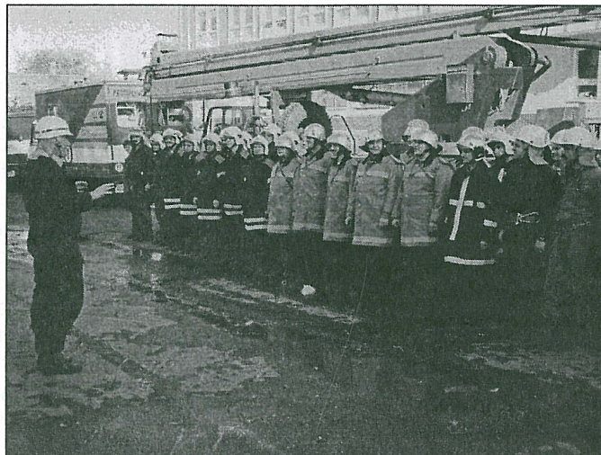
Hasiči při jednom ze společných cvičení.

Vedle společných cvičení a soutěží spolupracovali příslušníci zásahových jednotek také při skutečné katastrofě, a to při povodních v přilehlých oblastech, kde si také v praxi ověřili společný informační systém a prokázali, jak je takováto součinnost v Euroregionu Nisa potřebná.