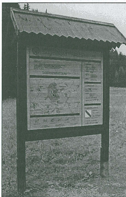
Ukázka jedné z možných vícejazyčných informačních tabulí pro turisty.

regionu NISA, například do oblasti Českého ráje, případně i dalších. Kanceláři ERN pak rada uložila zpracování dalších podkladů a s dotčenými obcemi projednání jejich zájmu o zapojení do tohoto projektu. Účast obcí by spočívala v zabezpečení