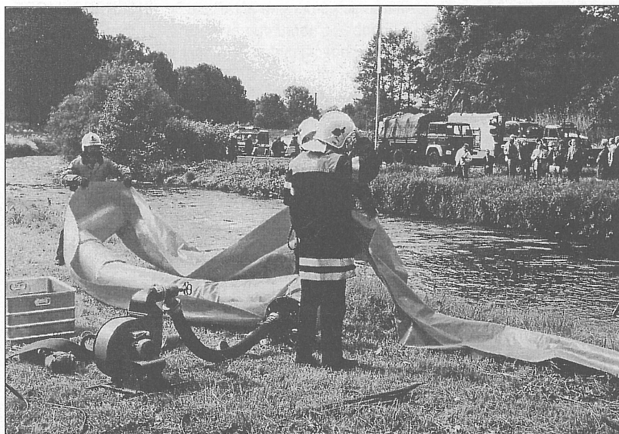
Společné cvičení českých, německých a polských hasičů v trojzemí 30. května 1997 v Hrádku nad Nisou.

Účastníci zasedání pak v závěru s politováním konstatovali, že pro nedostatek finančních prostředků české strany muselo být odvoláno připravované „Sportovní setkání mládeže“ na září letošního roku do Liberce, které mělo být pokračováním loňské úspěšné Olympiády mládeže v Hoyerswerd.