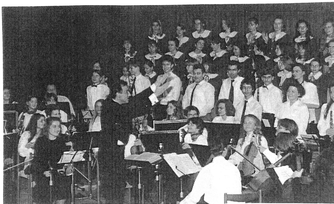
EUROPERA - studentský orchestr