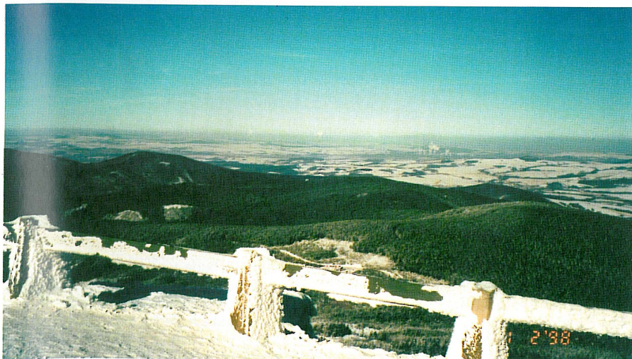
Pohled na německou a polskou část Euroregionu Nisa z Ještědu

gramu Phare. Výhodnější by ovšem bylo dosáhnout vytvoření fondů, konkrétně v oblastech rozvoje cestovního ruchu, obnova venkova a rozvoj technické infrastruktury měst i obcí s tím, že pravomoc na financování oněch drobných požadavků by přešla na euroregion. Současně rada uložila zpracovat podrobnou písemnou informaci o stavu tohoto programu a poskytnout ji všem členům rady.