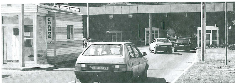
Silniční hraniční přechod Hrádek nad Nisou – Porajow

Četné další iniciativy se uskutečňovaly mimo rámec těchto pracovních skupin, ale s účastí zástupců ERN a budeme o nich průběžně informovat v příštích bulletinech.