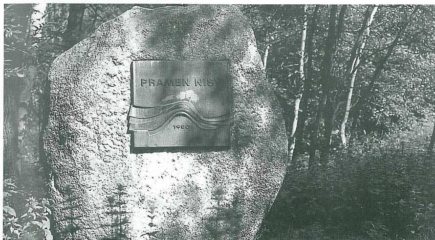
Ukázka z obrázkového kalendáře ERN