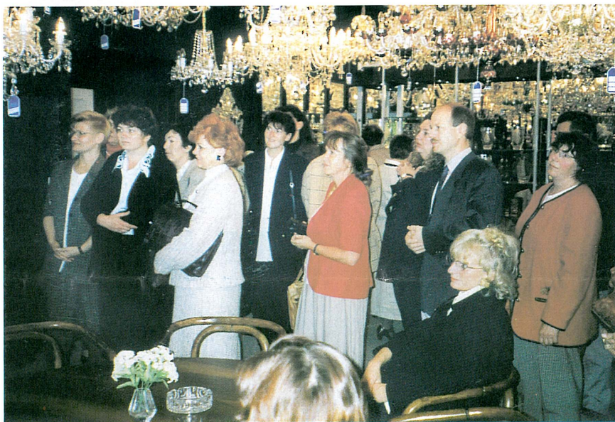
Při jednom z pracovních setkání si účastnice kurzu také prohlédli vzorkovnu skla v libereckém zámku.

mavých podnětů ke spolupráci. Prvořadým přínosem pro účastnice kurzu byla možnost dalšího vzdělávání. Projekt pokračuje i v roce 1999, takže celkové podrobné vyhodnocení bude zpracováno až po jeho dokončení. *