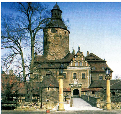
Na snímku zámek Czocha a zámecká recepce

Příjemné prostředí zámku, dobrá organizace setkání a přátelská atmosféra byly umocněny zajímavou exkurzí k Lešňanskému a Zlotnickému jezeru. Celé setkání pak přispělo k navázání těsnějších dvoustranných kontaktů některých ze zúčastněných organizací.