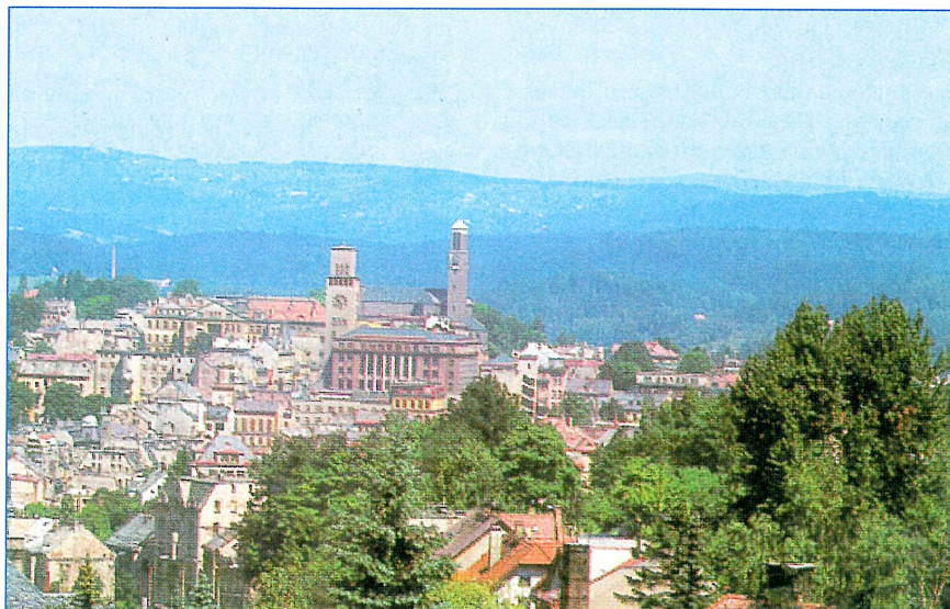
Jablonec nad Nisou – druhé největší město české části Euroregionu Nisa