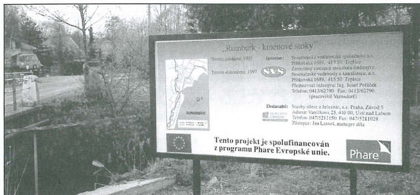
„Rumburk-kmenová stoka“ – jeden z projektů podpořených z programu Phare

Ochrana životního prostředí prostřednictvím prevence (včetně prevence přírodních a technologických katastrof), monitorování, obnovy ekologicky postižených