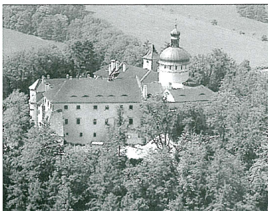
Státní hrad a zámek Grabštejn

Starosta obce Ralsko pak přítomné seznámil s historií i současností obce a pozval je k prohlídce bývalého vojenského prostoru.