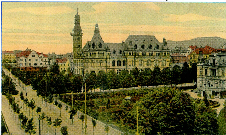
Dobový pohled na Severočeské muzeum 1907, které bude místem historického symposia „Umělecká řemesla bez hranic“.