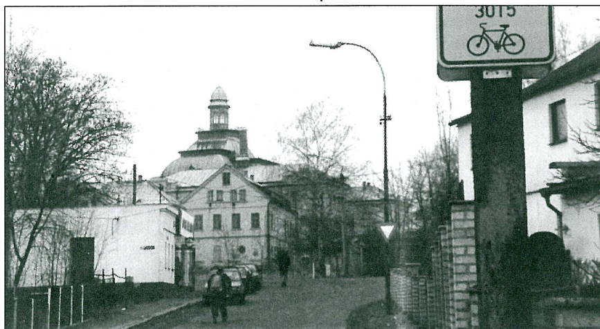
Cyklostezky v okolí Varnsdorfu realizovala ARR - NISA v roce 2000. Dnes již dokonale vyznačená oblast nabízí 10 turistických hraničních přechodů do sousedního Saska. Trasa č. 3015 propojuje hraniční přechod ve Varnsdorfu s přechodem v Dolním Podluží u obce Walterdorf. Dále pokračuje kolem hradu Tolštejn na Jedlovou a Kytlice.

Dále se členové skupiny kromě jiného dohodli, že značení cyklotras bude v každé zemi dle vlastní metodiky a předpisů.