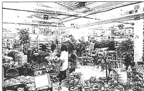
Jeden z velkoplošných supermarketů OBI

OBI provozuje v Evropě již více než 370 velkoplošných obchodů. Jen v Německu jich přibývá ročně 10 až 15, v dalších zemích