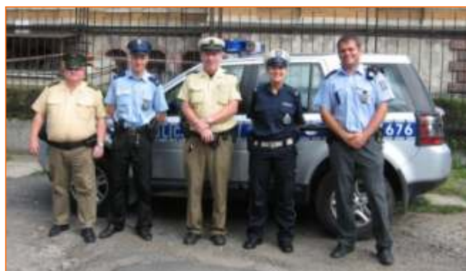
Od roku 2009 se během prázdninových měsíců konají společné polsko-česko-německé hlídky. Tyto hlídky se realizují v Bogatyni, Hrádku a Žitavě.