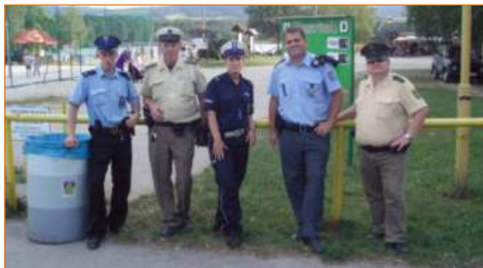
Wspólny polsko – czesko – niemiecki patrol policyjny