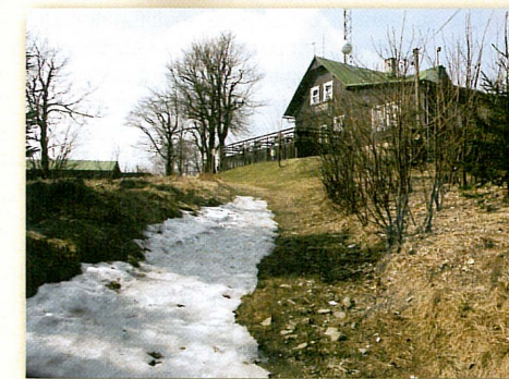
Ještědský hřeben (chata na Pláních)