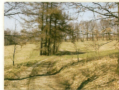
Jizerské hory (Pašerácká stezka)