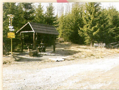
Lužické hory (rozcestník pod Jedlovou)