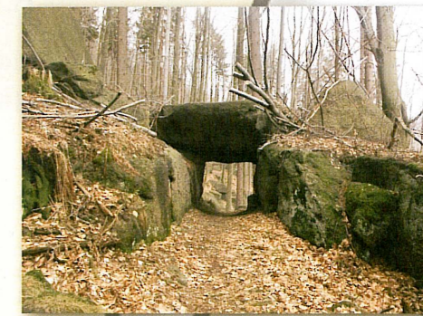
Jizerské hory (Brana)