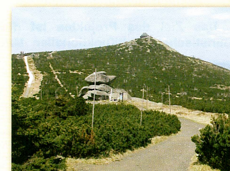
Krkonoše (Tvarožník a Szrenica)