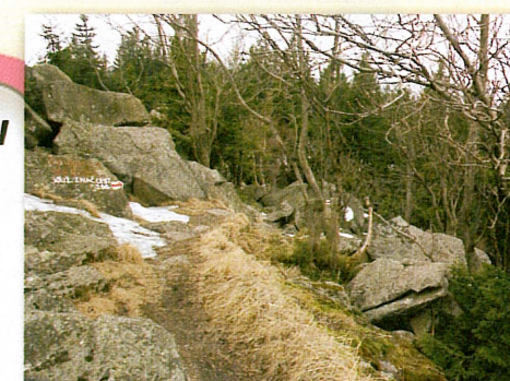
Černostudniční hřbet (cesta na Muchově)