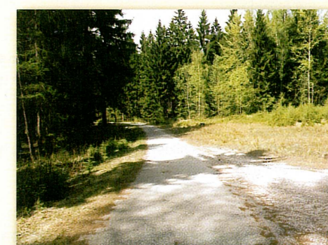
Krkonoše (cyklostezka z Harrachova)